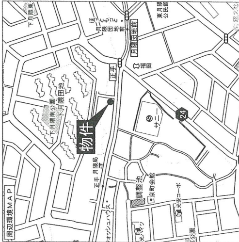
■図面と現況が相違する場合は現況優先とさせていただきます。